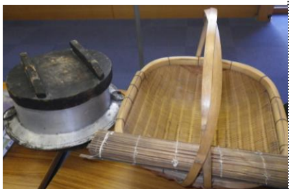
昔の用具も教材になります