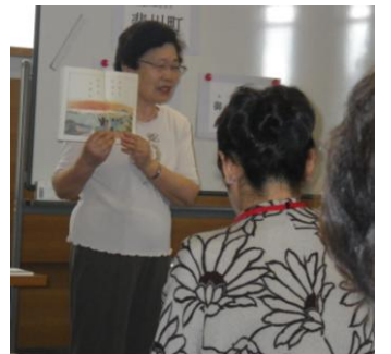
昔の教科書を教材にします

この事業の企画は、Cブロックの新雑賀町地区の福祉推進員さんでした。お世話になりました。