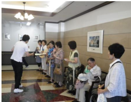
シニアコート東朝日町