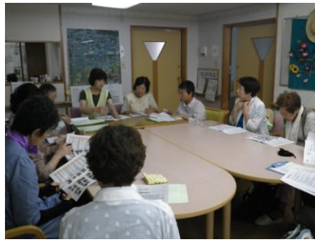
グループホームユミー