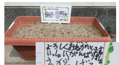
指導のとおり に植えつけが できました