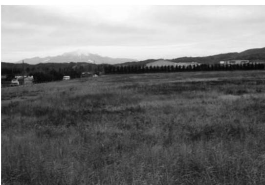
元暫定ため池7.5ヘクタールは工業団地として取得を検討

利用の仕方があると思います。周辺部は事業所の集積があり、関連の深い企業が来れば効果も上がっていくと考えており、今後、ご指摘があるような土地の取得に向けて検討に着手をしていきたいと思っています。