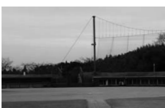
東出雲中央公園野球場

安部副教育長 硬式野球と軟式野球で、利用できる野球場の規格については特段の違いはありませんが、ボールが場外に飛び出した場合の安全性を考慮して、施設管理者が硬式での利用について一定の制限をしているのが現状です。東出雲中央公園野球場は、フェンスの高さ等の安全性