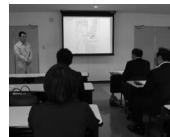
「日本原燃・原子燃料サイクル施設」視察

「松政クラブ」の会派研修で、青森県六ヶ所村の「日本原燃・原子燃料サイクル施設」を7月6日に視察しました。島根原子力発電所1号機の廃炉に伴う使用済み核燃料の搬出予定先です。視察では、高レベル放射性廃棄物のガラス固化の技術や徹底した安全対策などを確認しました。「百聞は一見にしかず」でした。