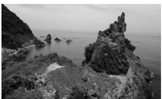
島根町の美しい海岸

1次審査で4地域のうち国引きジオパークを含む2地域が残りました。今秋の認定をめざし、国引きジオパーク推進協議会が中心となって地域を挙げ