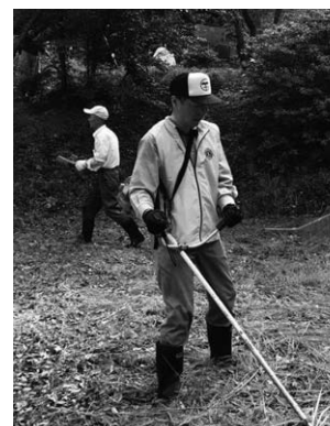
「夜見路庵」周辺の草刈り

地域の清掃活動に積極的に出かけています。6月11日には「中海・宍道湖一斉清掃」に東出雲町意東海岸に、7月2日は揖夜神社境内の「夜見路庵」周辺の草刈り。もちろん、集落の清掃活動にも参加しています。いい汗がかけると、出会った皆さんとの語らいは大きな収穫です。出会ったらお気軽に声をかけてください。