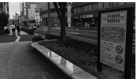
喫煙制限区域表示に工夫を松江駅前の表示(上)と八王子市の表示(左)

松浦市長 駅北側の道路が喫煙制限区域になっていますが、駅広場への拡大については地元自治会や関係機関の同意が必要であり、今後協議を行う考えです。