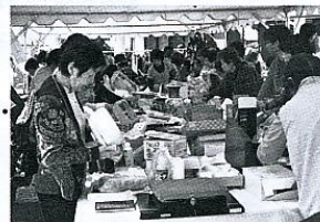
きずなクラブ バザー