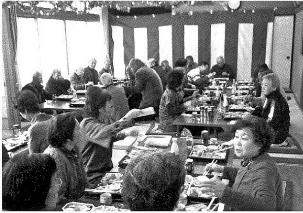
南平台ときわ会 食事会

南平台地区は近年空き地、空き家が目立つようになり、さらに以前は元気な子供の声が出ていましたが、この頃は子供の数が減りお年寄りが目立つようになりました。年寄りといっても元気な人が多く、ときわ会は約120名の会員がいます。