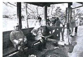
健康ウォーキング