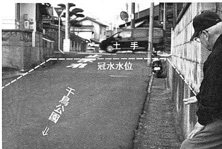
千鳥公園から見た土手

でも、宅地の問題は簡単ではありません。無視されることもありますが、知らずに事を行うことは大きな損失を伴います。そして今、四十間堀川放水路新設と狹窄部拡幅工事が30年計画で始まろうとしています。私は年齢の都合で成果を知ることができないのが残念です。