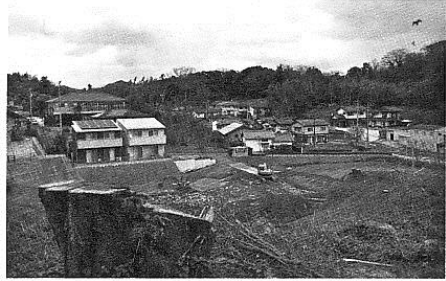
変わりゆく国屋下

国屋下ことぶき会は、男性19名、女性16名、計35名です。一年の行事としましては、新年会、総会、ニュースポーツのスカットボール及びジャンケンペタンコで会員の顔合せをしております。町内の集会所が有りませんので近くの城西公民館を利用させていただいております。国屋下も田んぼが埋り新興住宅と化しました。当然、朝夕車輛も多く事故が心配になります。新入会員様の入会増員に力を入れていきたいと考えております。