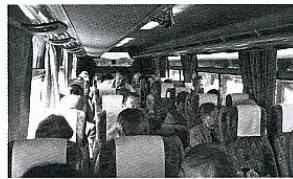
バスの中での懇談